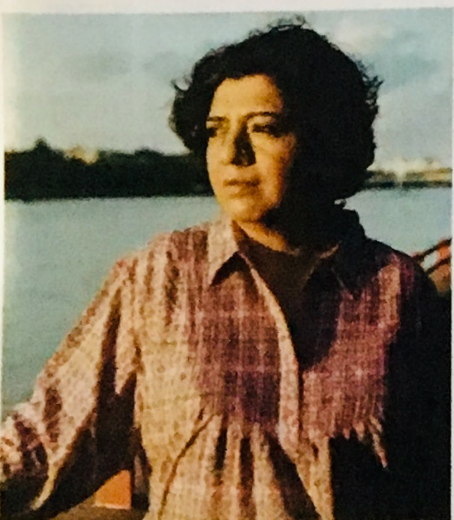
Asma Khan nella sesta stagione di Chef's Table .

Sta per ritornare (e la aspettiamo tutti con ansia) la nuova stagione di Chef's Table . Il programma di Netflix che ha rivoluzionato il modo di comunicare e raccontare il cibo in tv. Immagini belle e preziose. Uno storytelling pensato con attenzione. Storie, di cuochi, che sembrano uscite da romanzi. E dietro tutto questo c'è lui, David Gelb, regista e creatore della serie cult. Dopo il documentario su Jiro, il trisellato di Tokyo re del sushi, ha costruito pezzo dopo pezzo Chef's Table portando la capacità narrativa del grande cinema al docufilm gastronomico. Tra i nuovi personaggi Asma Khan e Dario Cecchini, macellaio toscano. Pronti per la sesta stagione? Io non vedo l'ora.