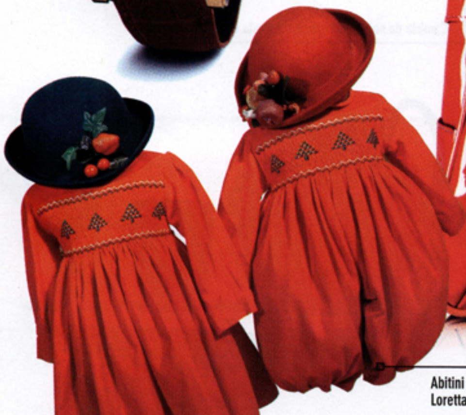
Abitini con punto a smock Loretta Caponi, euro 250