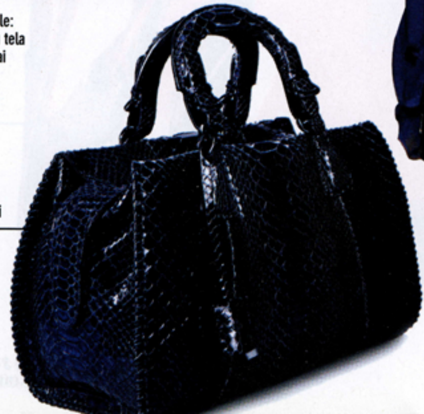
Venus Bag by Giorgio Armani