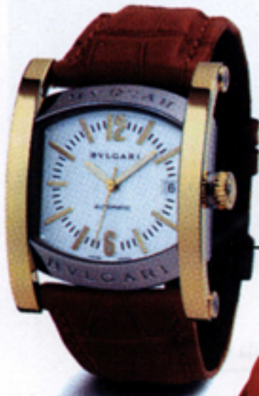
Assioma di Bulgari: cassa in oro giallo a 18 carati

Rosso come Marilyn Monroe o rosso Coca Cola. A proposito di Coca Cola: lo sapete perchè Babbo Natale è vestito di rosso? E' proprio grazie alla Coca Cola che nella metà del secolo scorso per pubblicizzare la nota bevanda colorò il vestito bianco di Santa Claus di un rosso fuoco. Ecco che da allora il rosso è diventato il colore più glamour del Natale!