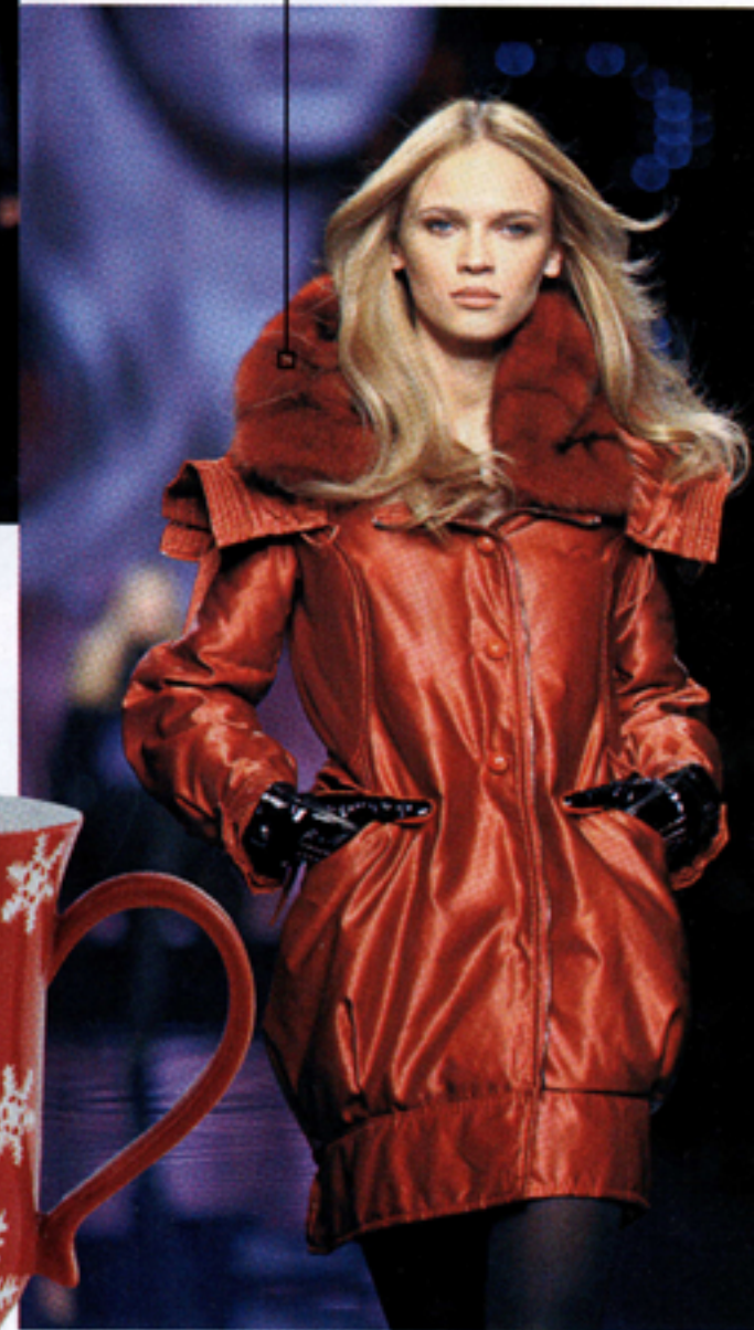
Per il grande freddo giacca con collo di pelliccia Scervino