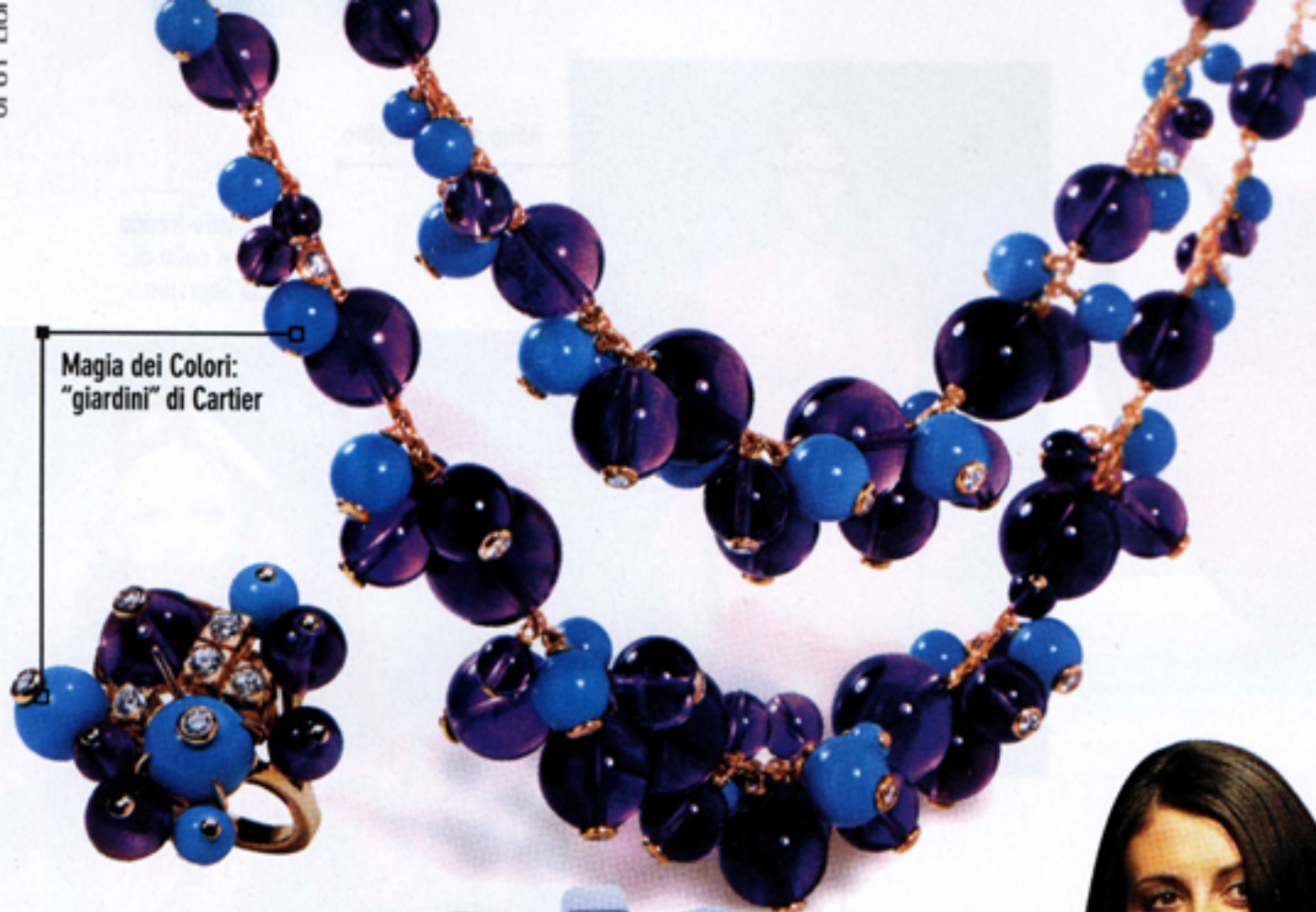
Magia dei Colori: "giardini" di Cartier