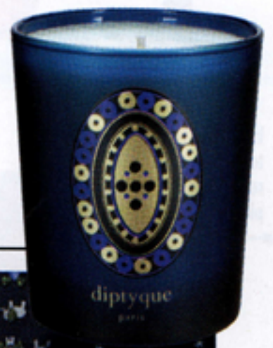
Candele colorate in edizione limitata di Diptyque Paris, 60 euro

L'eleganza è blu: blu come i fondali del Mediterraneo, blu come le notti stellate nelle cime dolomitiche. Così come sono blu i prodotti più belli creati dai nostri artigiani, coloro che sanno far brillare, con un tocco d'artista, la nostra fantasia.