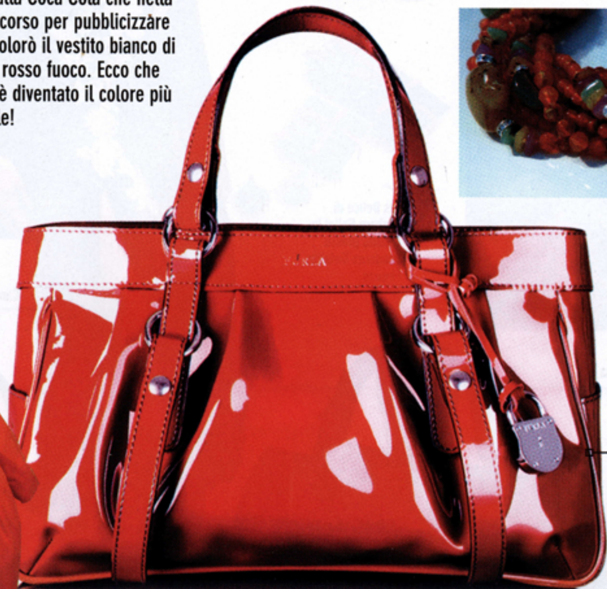
Borsa Jill in pelle lucida Furla via Calzaiuoli Firenze