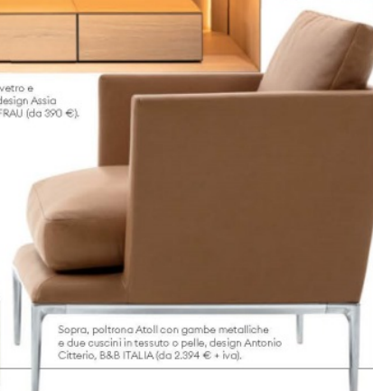
Sopra, poltrona Atoll con gambe metalliche e due cuscini in tessuto o pelle, design Antonio Citterio, B&B ITALIA (da 2.394 € + iva).