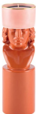
Sopra, candela scultura Il Letterato, design Luca Nichetto, GINORI 1735 LCDC (290 €).