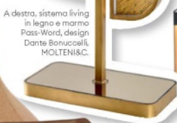
A destra, sistema living in legno e marmo Pass-Word, design Dante Bonuccelli, MOLTENI&C.

Curve, intagli, intarsi. Vetro che imita l'acqua, metallo che si fa trama luminosa. Una selezione sartoriale, che sposta le frontiere della personalizzazione.