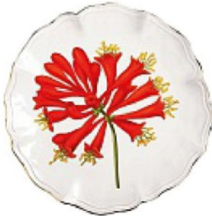
EFFETTO rétro per il piatto in porcellana con fiori, &KLEVERING euro 23,95.