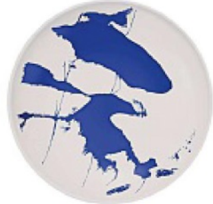
S'ISPIRA all'architetto e designer Charlotte Perriand, CASSINA euro 311,10.