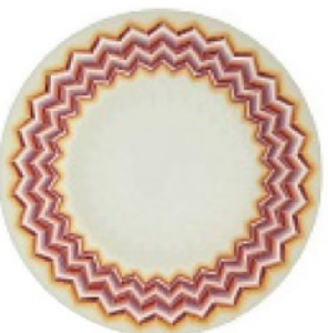
LO ZIG-ZAG più famoso arriva sul piatto in porcellana, MISSONI euro 205.