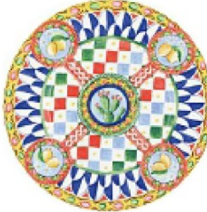
UN CARRETTO siciliano per il piatto, DOLCE&GABBANA euro 600 la coppia.