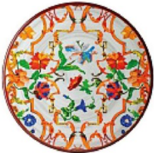
MELAMINA full color dai motivi floreali, MARIO LUCA GIUSTI euro 34.