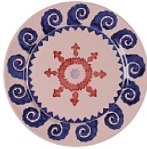
DALLA COSTIERA amalfitana, in ceramica di Vietri, EMPORIO SIRENUSE euro 110.