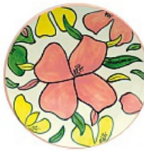
HA UN'ARIA da Anni 70, con macro fiori, POPUS EDITIONS da euro 18.