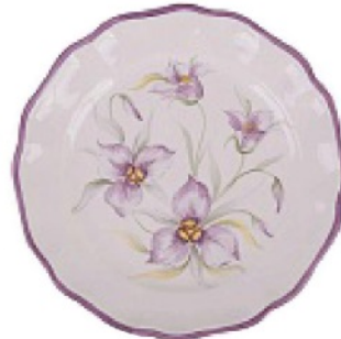
DELICATO e romantico, in ceramica dipinta a mano, VIO'S SHOP euro 50.