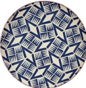
TRA MODERNO e classico, dedicato al designer David Hicks, CABANA MAGAZINE euro 60.