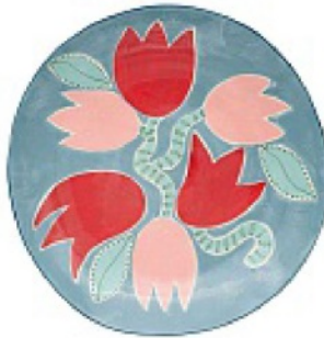
È DIPINTO a mano, in porcellana, LAETITIA ROUGET su madeindesign.it euro 160.