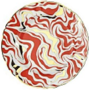
FIAMMEGGIANTE il piatto in porcellana con dettagli oro, BITOSSÌ HOME euro 35,10.