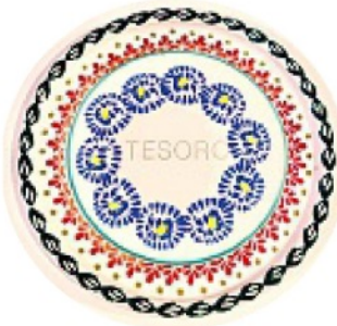
HAND MADE con tecniche tradizionali risalenti all'800, MV% CERAMICS DESIGN euro 38.