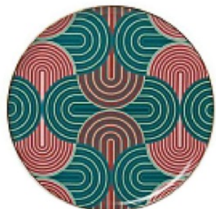
GEOMETRIE Seventies e colori a contrasto per il piatto da portata, LA DOUBLE J. euro 110.