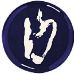
FIRMATO dall'acclamato chef israeliano Yotam Ottolenghi, in porcellana, SERAX euro 20,50.