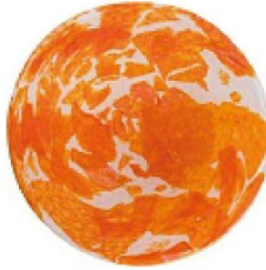
SONO uno diverso dall'altro, in vetro di Murano, STORIES OF ITALY euro 1.495 il set da 6.