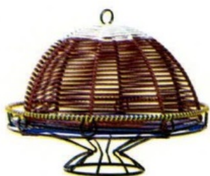
Artigianale, in ferro rivestito di pvc intrecciato [Marni, ø cm 32x24h € 180].