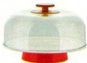
Essenziale Mattina, in porcellana, legno e PMMA [Alessi, ø cm 31,6x21,5h € 145].