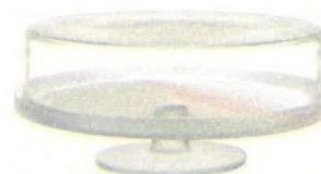
Cristallo senza piombo per Pigmento, design Formafantasma [Nude Glass, ø cm 30x13h € 173].