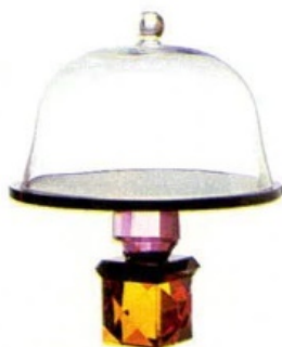
Scultorea, Elegance con base in cristallo sfaccettato [Henriette su » kalosstores.com, ø cm 30x36h € 413].