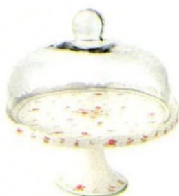
Nonna Rosa, rétro in porcellana e vetro [Brandani, ø cm 28x29h € 80,50].