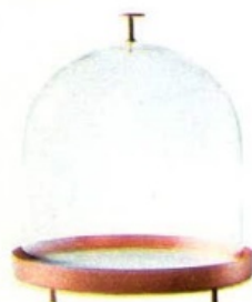
New Moon, realizzata a mano in rame, marmo e vetro soffiato [Paola C., ø cm 40x37h prezzo su richiesta].