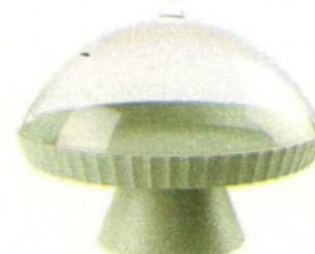
In polipropilene riciclabile, Agorà: puro stile British in sei colori [Blim Plus, ø cm 30x24h € 40,25].