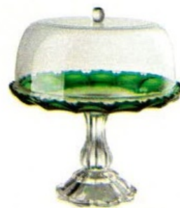
Girasole, in acrilico, 4 colori [Mario Luca Giusti, ø cm 33x21,5h € 135; campana cm 15,5h € 40].

Basta una 'cupola' per nobilitare qualunque cosa ci sia dentro! Per questo è bello avere un'alzata da tenere a vista in cucina, magari con i dolci per la colazione... Poi, nei giorni di festa, diventerà il tocco di classe da portare in tavola. E puoi scegliere: alzata classica o moderna, con campana in vetro o in acrilico.