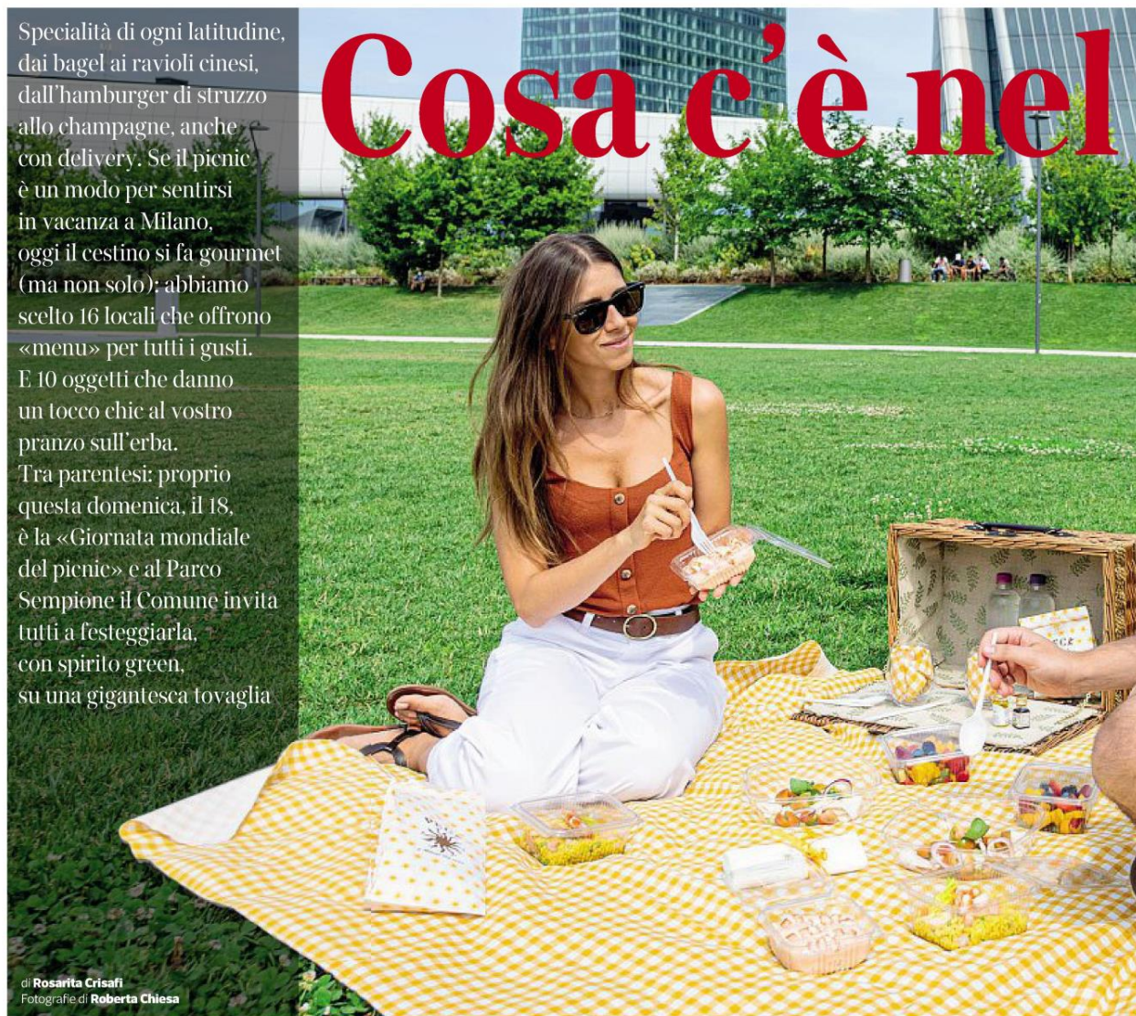
di Rosarita Crisafi