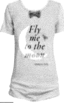
LA T-SHIRT Patrizia Pepe la disegna in edizione limitata per volare sulla luna nella notte della moda