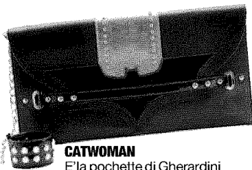
CATWOMAN E' la pochette di Gherardini stile Cavaliere Oscuro