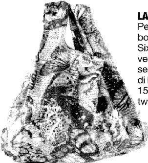
LA BORSETTA Per la VFNO la boutique di Sixty mette in vendita una serie limitata di borsette a 15 euro in twill di seta