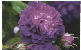
Cardinal De Richelieu