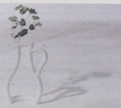
A sinistra il vaso Still Green ceramic. Sotto le lampade Moto Lamp by Hiyoshiya. A destra Plants chair by whigreen